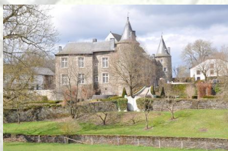
Le Château de Tavigny