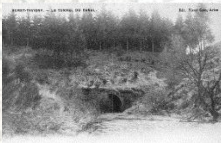
L'entrée du Canal